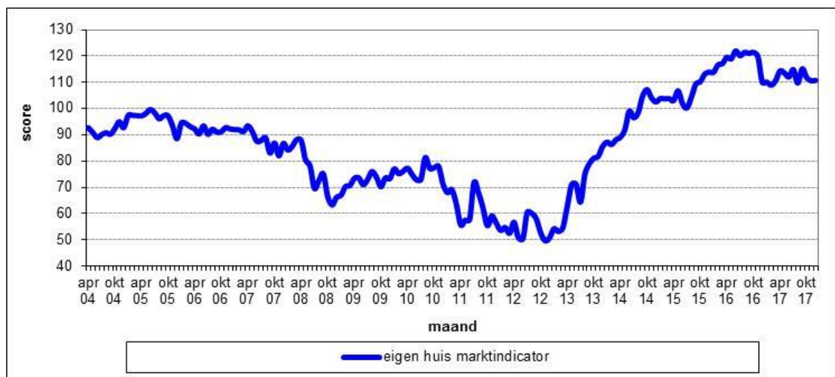
Figuur 2.1 De gemiddelde scores op de Eigen Huis Marktindicator, op maandbasis in de periode april 2004 – december 2017, in Nederland